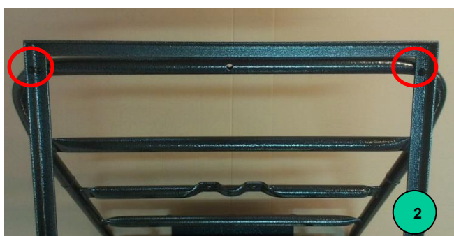
Obr. 2: Otvory na připevnění nástavby na přepravky v horní opěrné části korby Mokaře

Nástavbu přiložíme na korbu Mokaře. Přes otvory v rámu vlnařské nástavby narýsujeme polohu 6 otvorů. Polohy zvýrazníme důlčičkem. Otvory vyvrtáme vrtákem o průměru 5,5 mm a odjehlíme. Nástavbu s Mokařem spojíme šrouby a zajistíme podložkou a maticí.