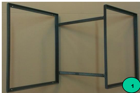
Obr. 1: Nástavba na přepravky – dodávaný komplet

Nástavbu přiložíme na korbu Mokaře. Přes otvory v rámu vlnařské nástavby narýsujeme polohu 6 otvorů. Polohy zvýrazníme důlčičkem. Otvory vyvrtáme vrtákem o průměru 5,5 mm a odjehlíme. Nástavbu s Mokařem spojíme šrouby a zajistíme podložkou a maticí.